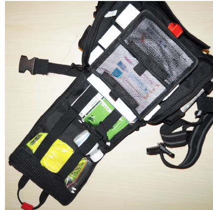
Abbildung: Innenansicht der ersten Ebene