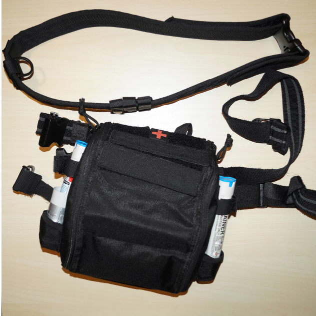
Abbildung: Prototyp CBRN-Selbsthilfeset