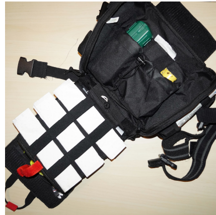
Abbildung: Innenansicht der zweiten Ebene