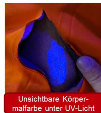
Unsichtbare Körper- malfarbe unter UV-Licht